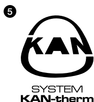
Рис. 5. Черный 100% Рис. 6. C: 0 M: 0 Y: 0 K: 100

В определенных случаях, определяемыми техническими условиями (факс, газетные репродукции), товарный знак может быть изображен в 100% черном цвете, как и его аналог в инверсной форме.