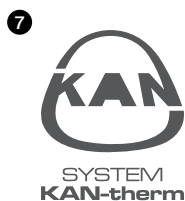
Рис. 7. PANTONE 425 C Рис. 8. C: 0 M: 0 Y: 0 K: 75

Товарный знак фирмы KAN также может быть распечатан в строго определенных оттенках (градациях) серого цвета (в зависимости от используемой вида носителя: мелованная и немелованная бумага, газетная бумага). В случае необходимости использования товарного знака фирмы в монохромных публикациях рекомендуется применять PANTONE 425 или в случае цветной печати - триадные (СМΥК) краски в соотношении цветов: C:00 M:00 Y:00 K:75.