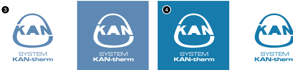
Рис. 3. PANTONE 646 Рис. 4. С: 75 М: 25 Y: 00 К: 25

Также допускается употребление товарного знака в инверсной монохромной форме с обязательным использованием в качестве фона строго определенного цвета из таблицы цветов.